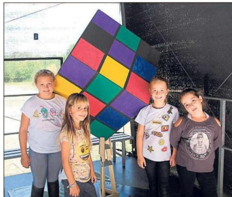
Zauberhaft geht es eine Woche im Aktivpark Phoenix zu.