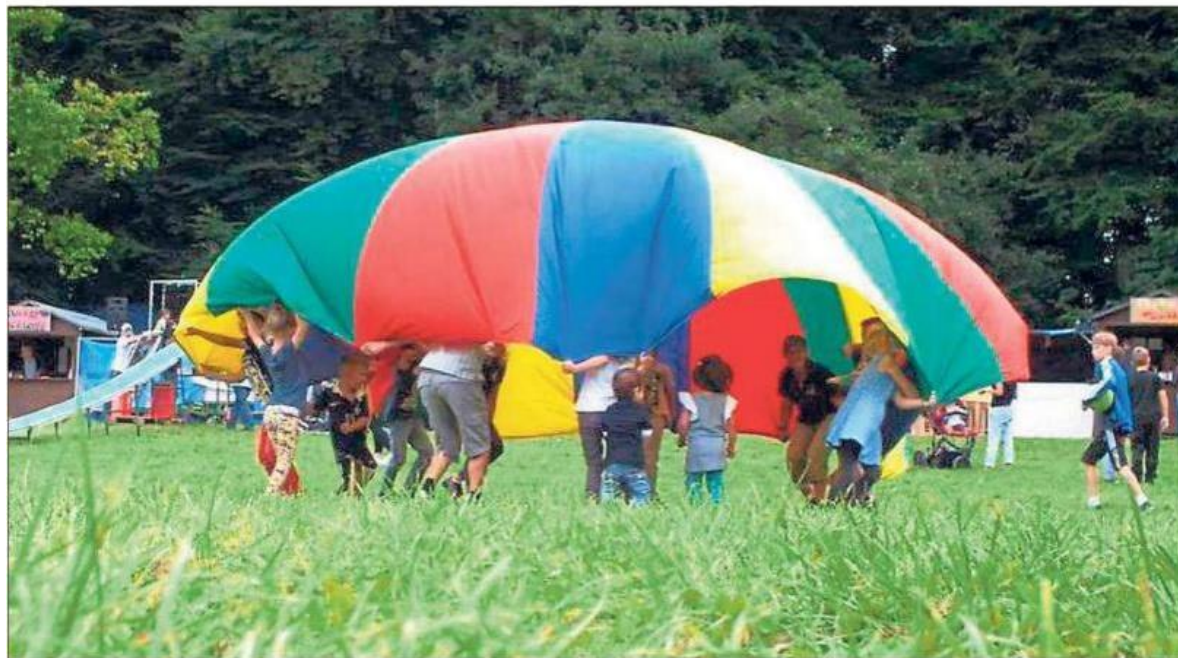
Das große Schwungtuch ist eine beliebte Attraktion bei den Ferienspieltagen.